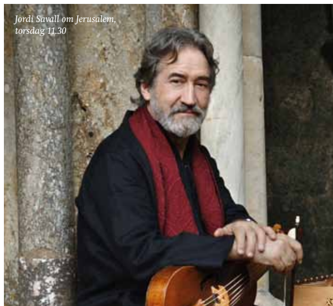
Jordi Savall om Jerusalem, torsdag 11.30