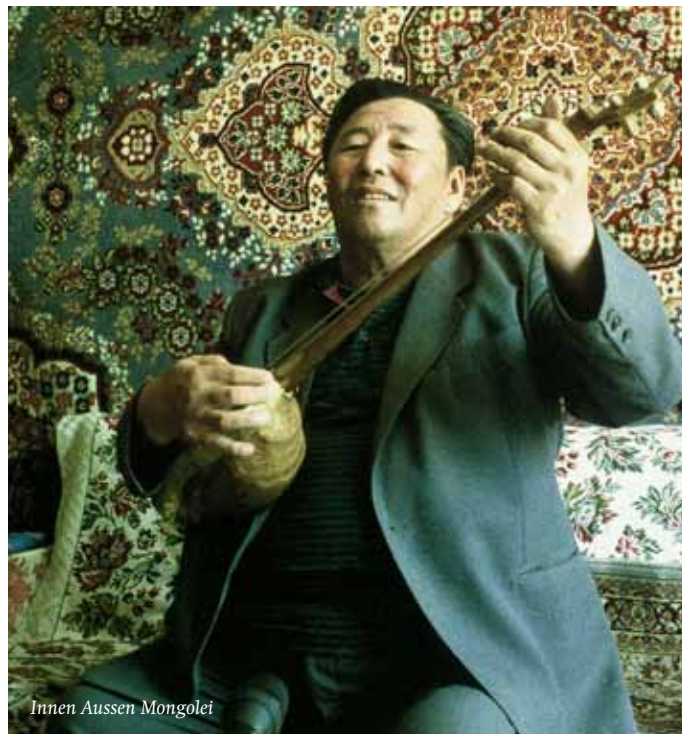
Innen Aussen Mongolei

English Deep into Mongolia, parallel worlds clash like dominoes on a gameboard. The eyes of a stranger discovers a landscape that looks into the past.