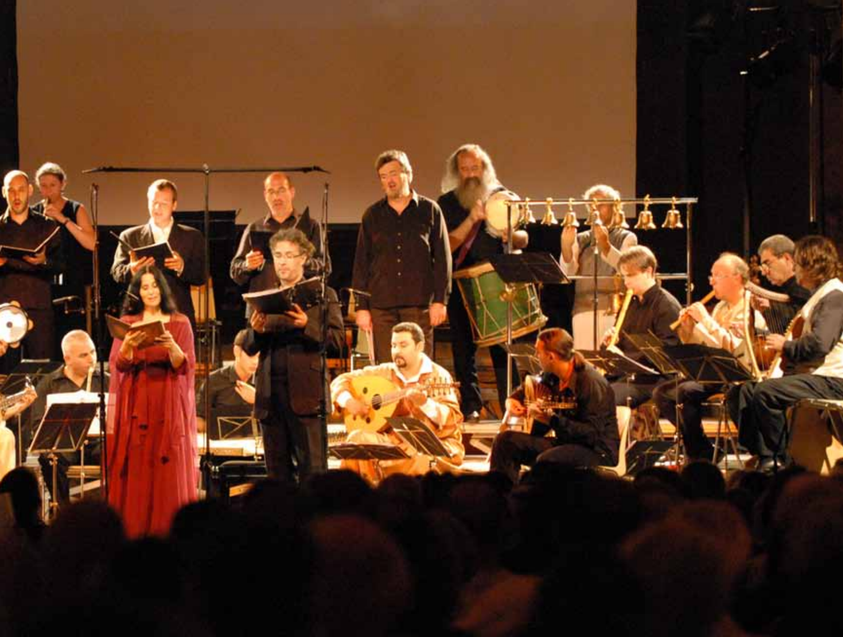
Jerusalem torsdag 19.00 Jordi Savall och 38 sångare och musiker. Med musik som förenar olika kulturer och religioner är Jerusalem ett hyllat fredsprojekt världen över.